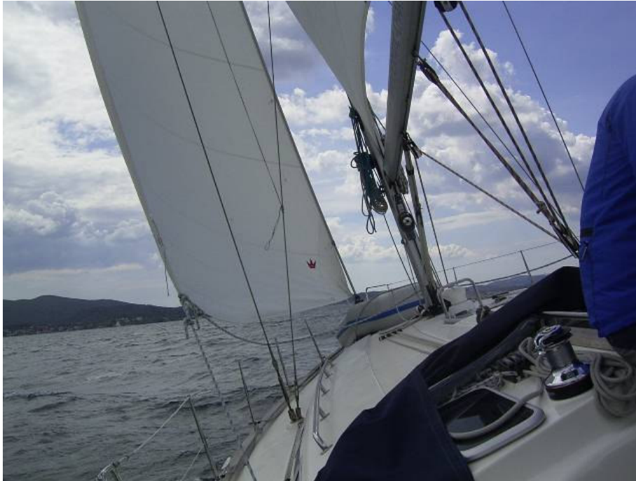
zum Abschluss 9kn

Am nächsten Tag war dann das Tagesziel wieder Sukosan. Wir kreuzten uns einen Wolf und kamen nicht auf Höhe. Der Motor musste uns an Biograd vorbei tragen. Danach drehte der Wind auf Nordwest und wir konnten zum Abschluss noch mit gerefftem Groß und komplett ausgefahrener Genua hart am Wind den Dampfer auf knappe 9 kn bringen- ein schöner Abschluss.