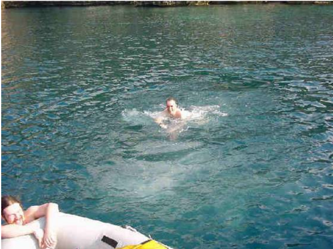
Ganz Mutige baden sogar im etwa 15°C kaltem Wasser.