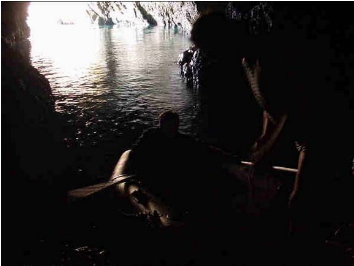
Geheimnisvolle Höhlen, von denen wir eine mit dem Schlauchboot erkunden.