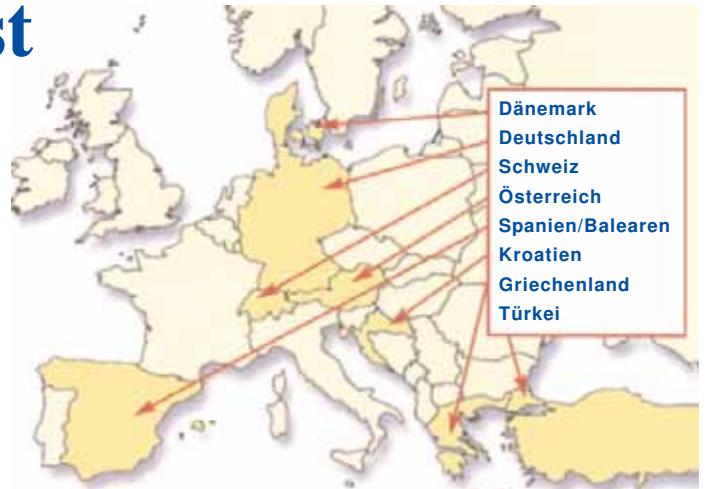
Expansion: YACHT-POOL besitzt nun acht Niederlassungen in Europa